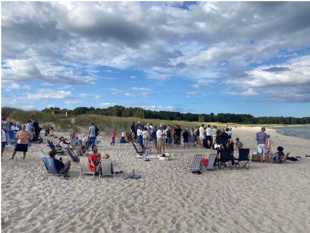
Bild från trivselkvällen den 25 juni 2023

I juli ordnade vi en liten trivselkväll på stranden med lite frågesport och lekar och förutom våra egna anordnade aktiviteter så har vi sponsrat midsommarfirande på Kajsas äng och Sandbybadets Golfmästerskap.