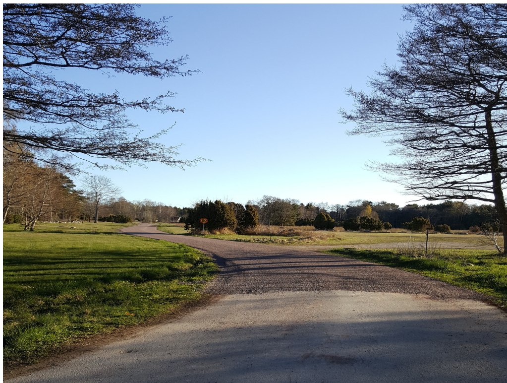
Strandängsgatan med ny beläggning

I början av sommaren la vi granitgrus på samtliga grusade vägar inom vårt område. För att få lite perspektiv på hur mycket grus det handlade om kan jag nämna att det gick åt 36 ton grus/300 m väg. Eftersom det är ca 2,8 km väg blev det ganska många lass som spreds ut. Avsikten framöver är att vi tidigt på våren, medan det fortfarande finns fukt kvar i backen, ska skrapa grusvägarna med väghyvel för att på så vis få så hög kvalitet som möjligt även på de grusade vägarna. Granitgruset dammar betydligt mindre än det kalkgrus som vi hade tidigare. Det kommer ändå inte att gå att få grusade vägar helt dammfria. Något av de mer trafikerade vägavsnitten kan kanske också behöva saltas på våren.